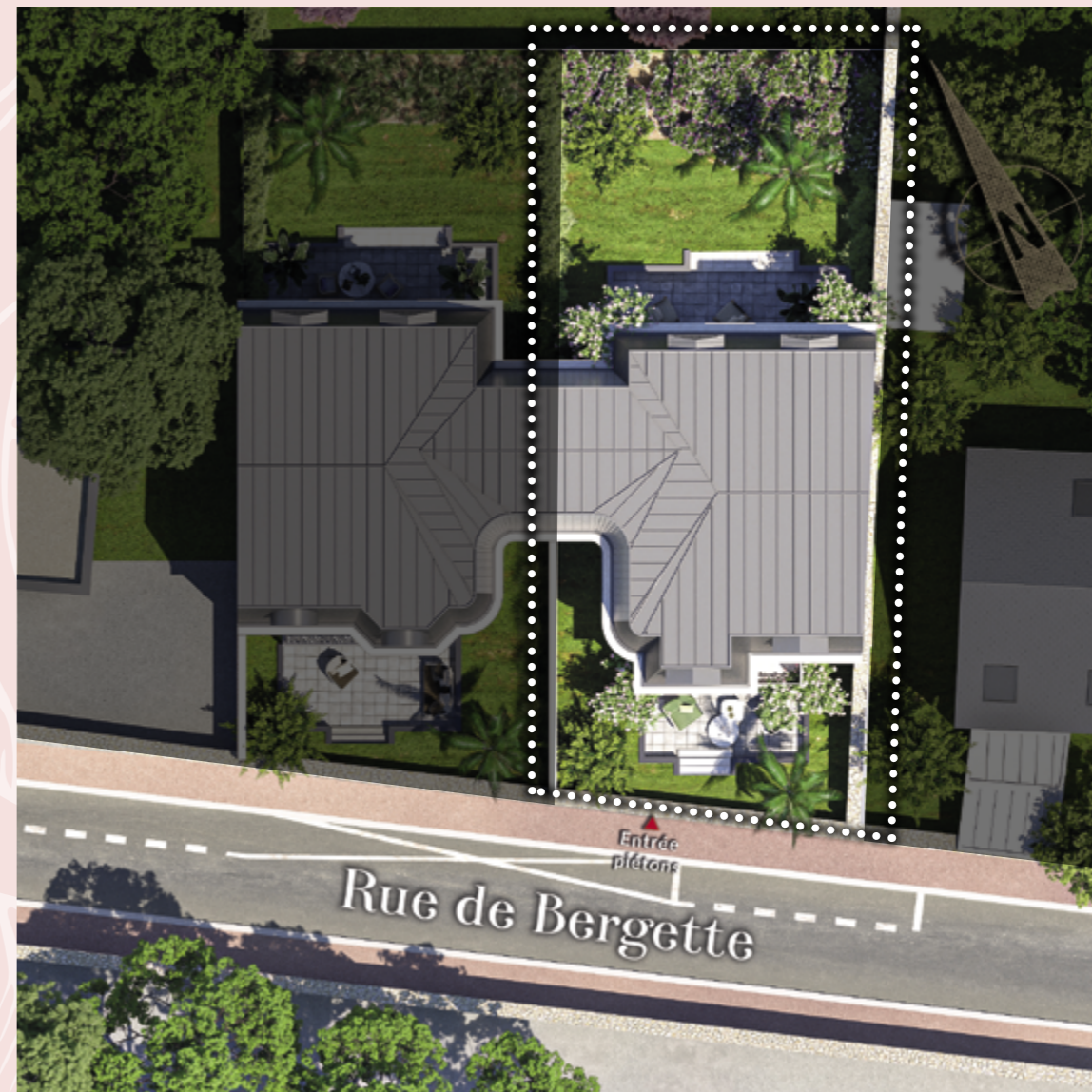
Illustration artistique à caractère d'ambiance