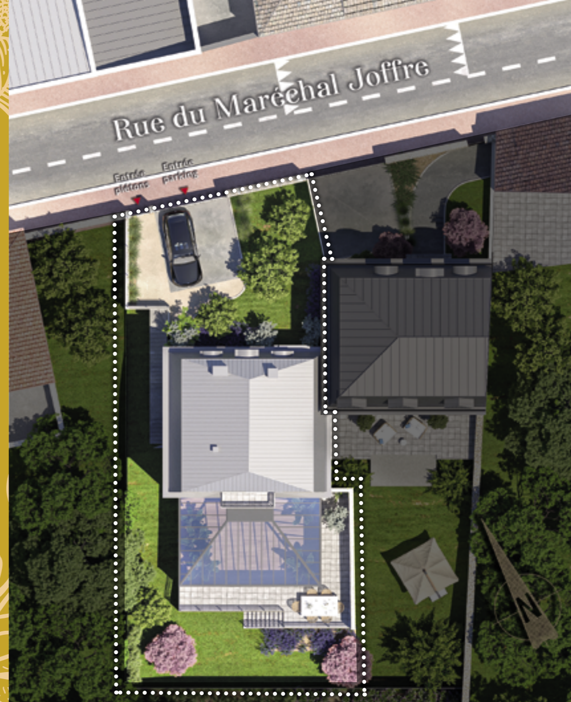
Illustration artistique à caractère d'ambiance